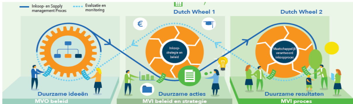
Figuur 2 The Dutch Wheels

De richtlijn 20400 omschrijft de wisselwerking tussen duurzame ideeën, duurzame acties (Dutch Wheel 1) en duurzame resultaten (Dutch Wheel 2). In onderstaande afbeelding is dit schematisch weergegeven.