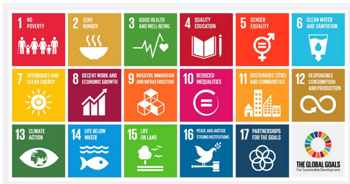
Figuur 1 De 17 Duurzame Ontwikkelingsdoelen

Net als andere landen rapporteert Nederland aan de VN over de voortgang. Alle stakeholders zoals overheden, NGO's, burgers én het bedrijfsleven worden expliciet betrokken bij de realisatie van de doelen. De doelen hebben dan ook impact op de bedrijfsvoering van Delfland.