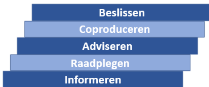
Figuur 4: Participatieladder voor bepalen participatieniveau (voor uitleg van de begrippen, zie bijlage 1)

De beïnvloedingsruimte moet passen bij de ruimte die er is voor inbreng van belanghebbenden. Bij het voorbereiden van een peilbesluit raadpleegt Delfland belanghebbenden, want de afweging van het waterpeil is een taak van het waterschap, die Delfland niet bij bewoners kan neerleggen. Ook de waterveiligheid staat niet ter discussie als er waterkeringen verhoogd of verbreed moeten worden, maar bij de inpassing van de aangepaste kering in de fysieke leefomgeving kunnen inwoners adviseren of samen met Delfland coproduceren.