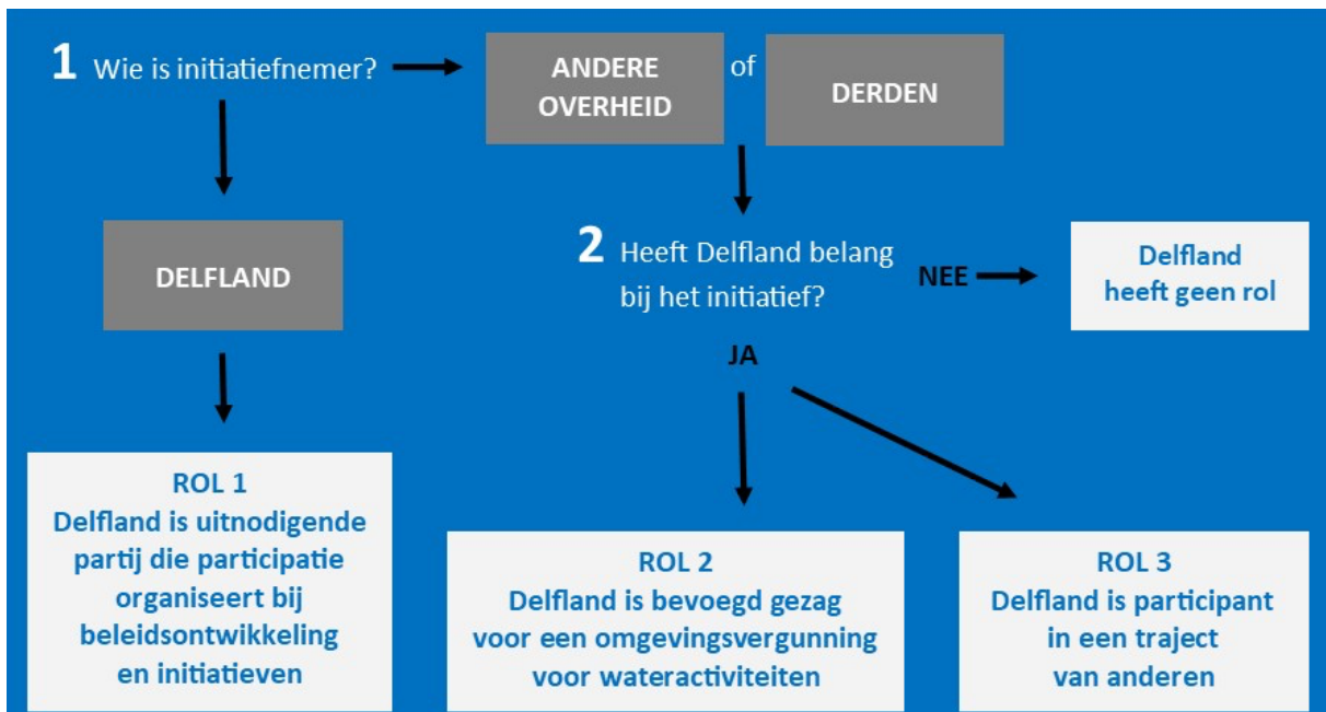
Figuur 2: Stroomschema om de participatie-rol van Delfland te bepalen