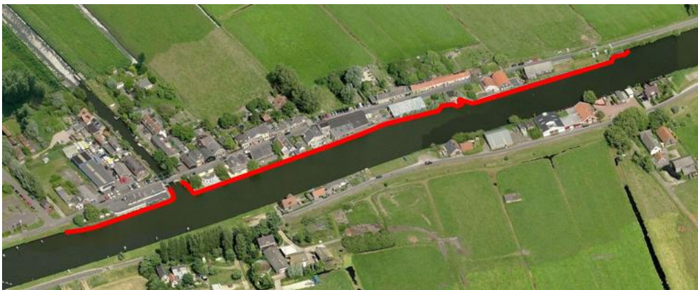
Projectgebied tracé regionale waterkering (verlegging naar de Schie)

De percelen aan weerszijden van de weg zijn particulier eigendom en in gebruik als woning met tuin. Ook is er een restaurant gevestigd. De Schie is grotendeels in eigendom van de gemeente Rotterdam. Een klein deel van de Schie is in eigendom bij de provincie Zuid-Holland en Delfland. De Rotterdamseweg is in eigendom van de gemeente Midden-Delfland. De Delftweg is eigendom van de gemeente Rotterdam. De provincie Zuid-Holland is eigenaar van een stuk grond dat wordt gebruikt als opslaglocatie.