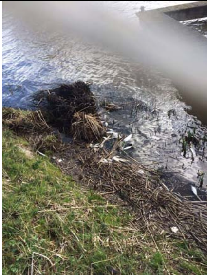
Dode vissen waargenomen langs de oevers van de Zweth

Dit formulier richten aan de voorzitter van de Verenigde Vergadering van Delfland mvanhaersmabuma@hhdelfland.nl met afschrift aan de griffier hfobler@hhdelfland.nl