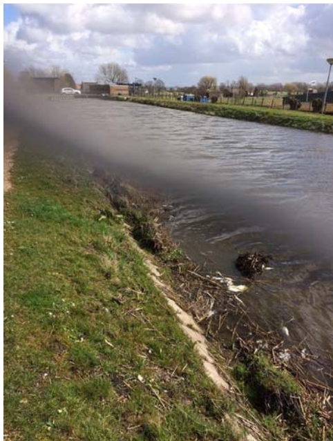
Locatie waar de vissterfte is waargenomen in de Zweth

Bijgevoegde foto's van de vissterfte en de dode muskuseend zijn gemaakt op de locatie Berkelse Zweth ter hoogte van de Zwethkade nummer 2 in Berkel en Rodenrijs op 29 maart 2016 (door Carla van Viegen, Gedeputeerde Staten fractie PvdD provincie Zuid-Holland).